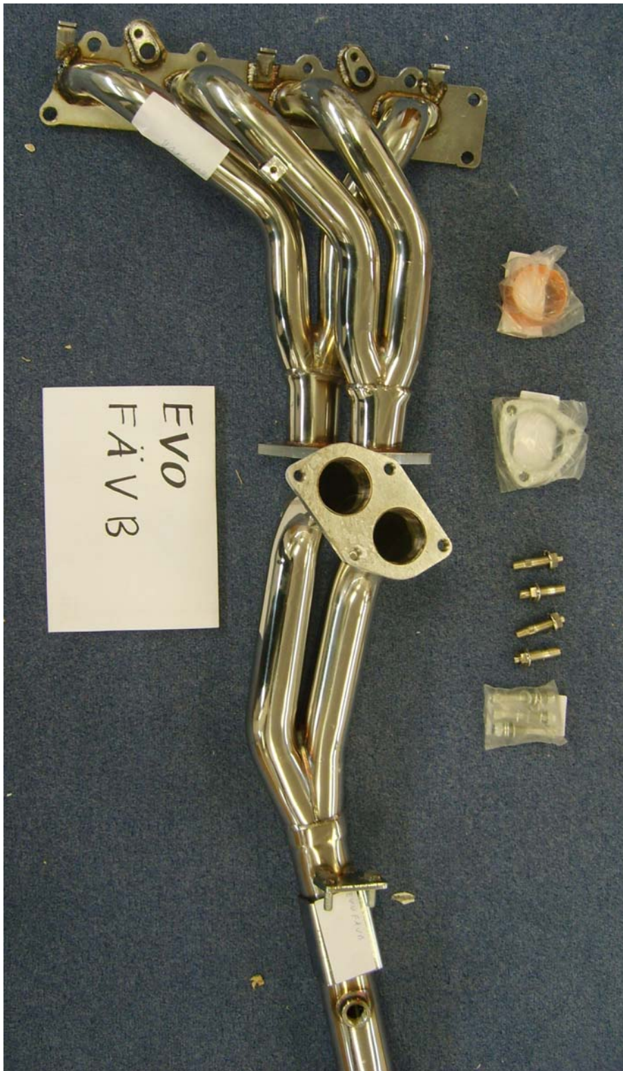
Auspuffkrümmer, Typ EVOFÄVB